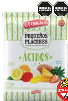
1651 Ácidos Frutales 12b x 450g