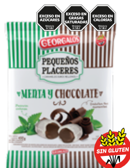
1676 Menta relleno de Chocolate 12b x 450g