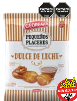
2102 Relleno Dulce de Leche 12b x 450g