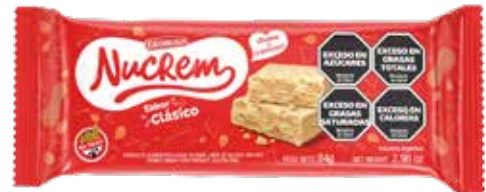
1692 Clásico 40u x 84g