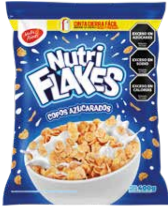
205 Copos Azucarados 24u x 400g