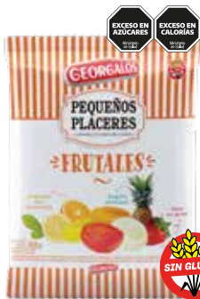
1648 Rellenos Frutales 12b x 450g