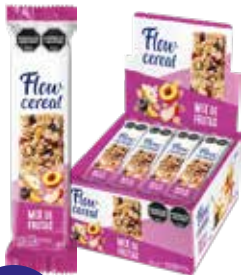
2006 Mix de Frutas 6d x 20u x 23g