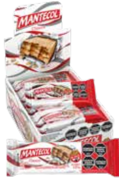
63600 Clásico 8d x 16u x 26g