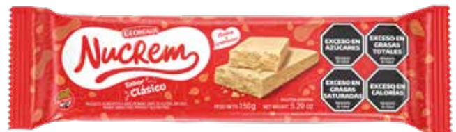
2604 Clásico 36u x 150g