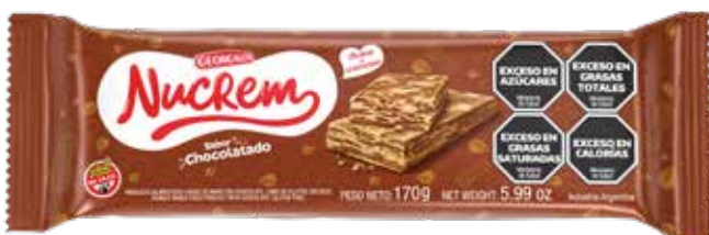
1703 Chocolatado 30u x 170g