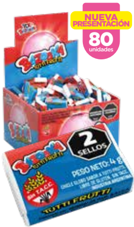
31103 Tutti Frutti 18d x 80u x 4g