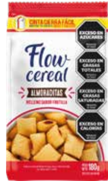
1960 Almohaditas relleno sabor Frutilla 32u x 180g