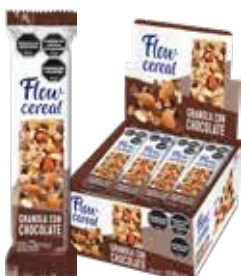
2000 Granola con Chocolate 6d x 20u x 23g