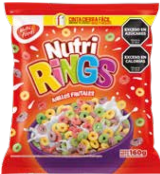
441 Anillos Frutales 20u x 160g