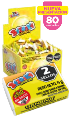
31101 Banana 18d x 80u x 4g