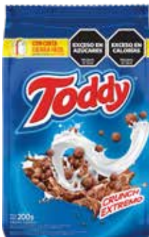
1963 Bolitas de Chocolate Crunch Extremo 16u x 200g