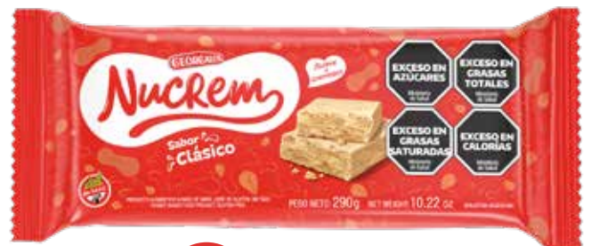
2616 Clásico 20u x 290g