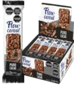
2034 Puro Cacao con piso de Chocolate 6d x 20u x 24g