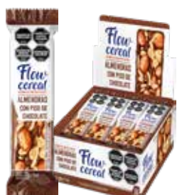
2024 Alm. Enteras piso de Chocolate 6d x 20u x 30g