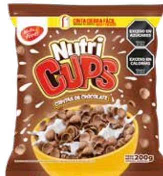
418 Copitas de Chocolate 20u x 200g