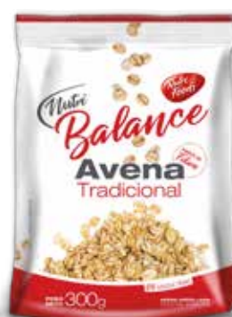
415 Avena Tradicional 24u x 300g