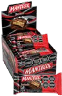
2637 Bañado 12d x 18u x 20g