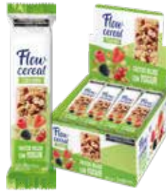
2017 Frutos rojos con Yogur Equilibrio 6d x 20u x 24g