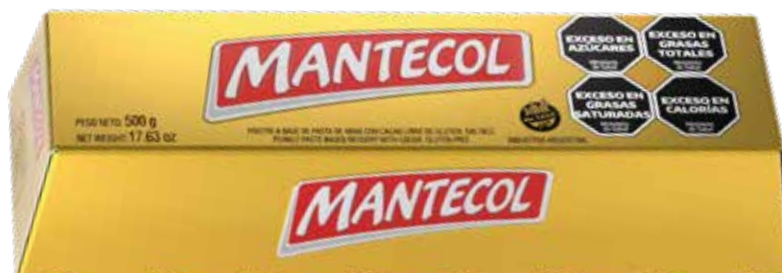
2636 Lingote 8u x 500g