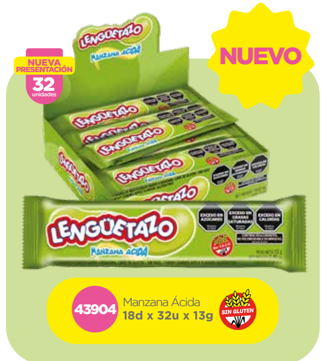
43904 Manzana Ácida 18d x 32u x 13g