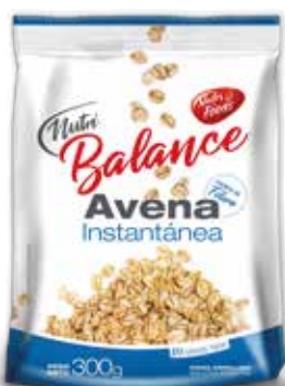
414 Avena Instantánea 24u x 300g