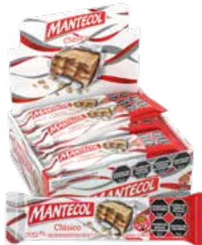
63900 Clásico 8d x 12u x 41g