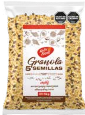
431 Granola 5 Semillas 7u x 1 kg