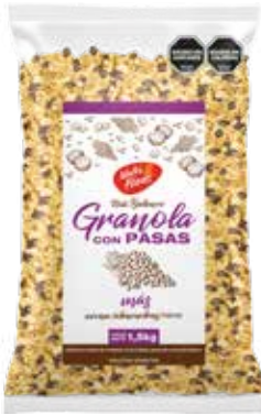
145 Granola con Pasas 5u x 1,5 kg