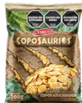
1952 Copos Azucarados 32u x 200g