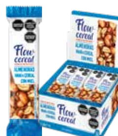
2023 Almendras Enteras 6d x 20u x 30g