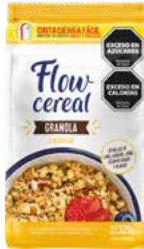
1962 Granola 5 Semillas 20u x 320g