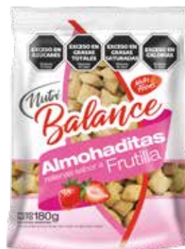
444 Almohaditas Frutilla 20u x 180g