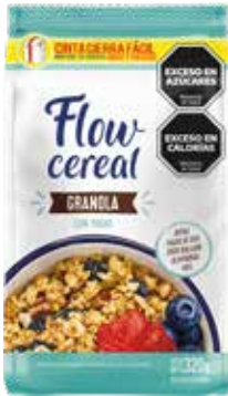
1954 Granola con Pasas 20u x 320g