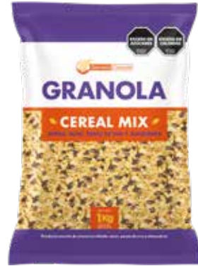
370 Granola Cereal Mix 7u x 1 kg