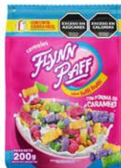
1982 Cereal Frutal con forma de Caramelo 16u x 200g