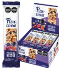
2002 Frutos del Bosque 6d x 20u x 23g