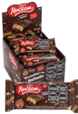
1698 Bañado con Chocolate 12d x 18u x 20g