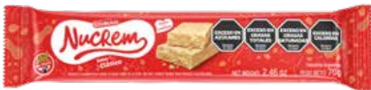
2623 Clásico 40u x 70g