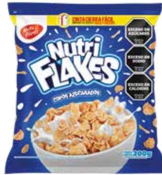
442 Copos Azucarados 20u x 200g