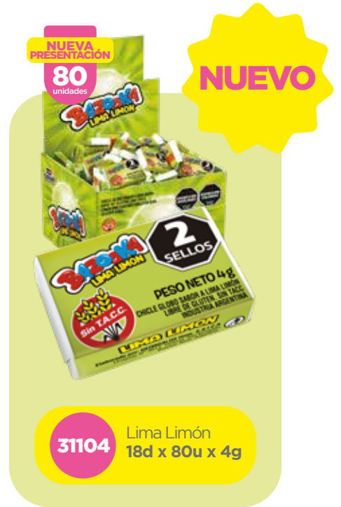
31104 Lima Limón 18d x 80u x 4g