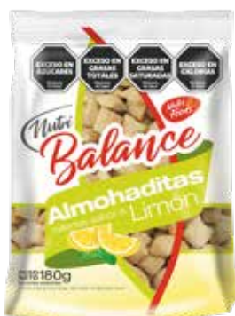
443 Almohaditas Limón 20u x 180g