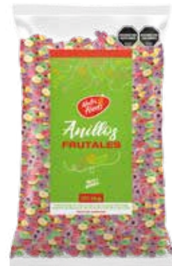
448 Anillos Frutales 10u x 1 kg