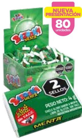
31102 Menta 18d x 80u x 4g