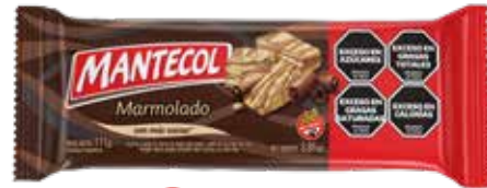
26600 Marmolado 40u x 111g