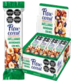
2027 Avellanas y Arándanos con Miel 6d x 20u x 30g