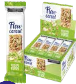
2005 Manzana Verde 6d x 20u x 21g