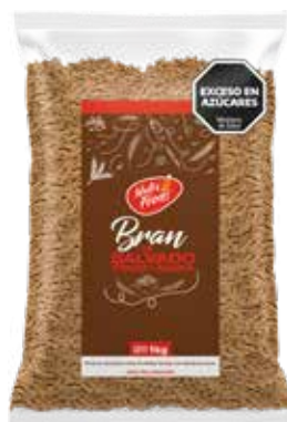
1981 Bran de Salvado y Avena 11u x 1 kg