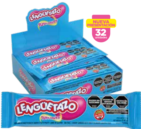
43901 Tutti Frutti 18d x 32u x 13g