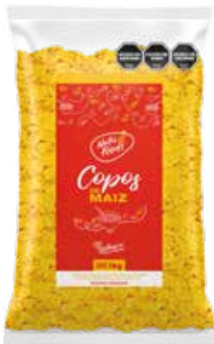
446 Copos de Maiz 11u x 1 kg