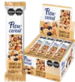
1502 Granola con Semillas 6d x 20u x 23g