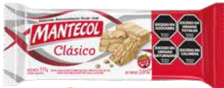
26400 Clásico 40u x 111g