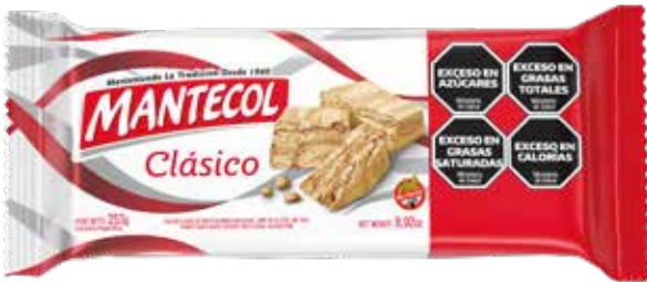
26800 Clásico 36u x 253g