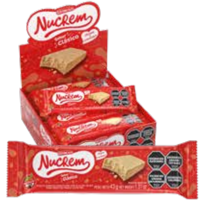
1691 Clásico 8d x 16u x 43g