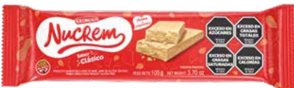
2611 Clásico 36u x 105g