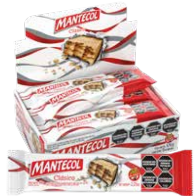
64200 Clásico 8d x 9u x 64g