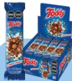
2035 Barra de Cereal con Chocolate Blanco y Chocolate Semiamargo 6d x 20u x 21g