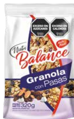
209 Granola con Pasas 20u x 320g