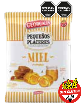
1659 Rellenos Miel 12b x 450g