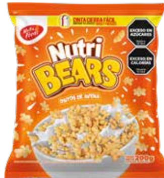
417 Ositos de Avena 20u x 200g