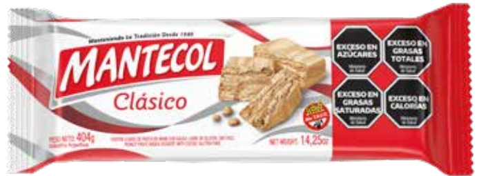
27000 Clásico 24u x 404g