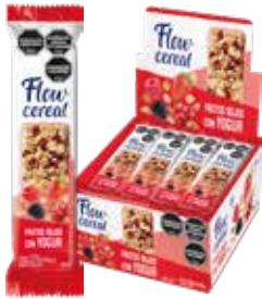
2004 Frutos rojos con Yogur 6d x 20u x 27g