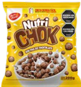
440 Bolitas de Chocolate 20u x 200g