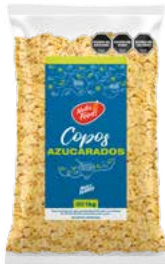
447 Copos de Azúcar 11u x 1 kg