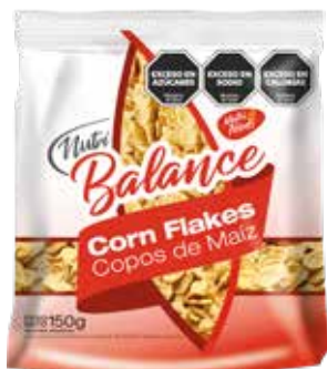
445 Copos de Maiz 20u x 150g