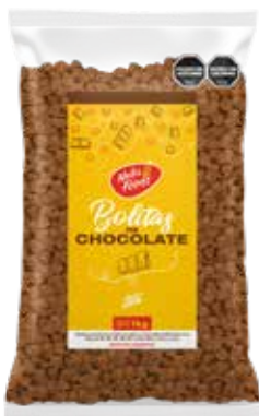
449 Bolitas de Chocolate 10u x 1 kg