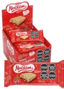
2621 Clásico 12d x 18u x 25g