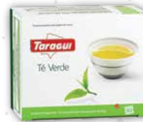
TÉ VERDE x40 saq.