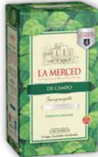
CAMPO OC x500g