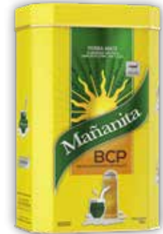
MAÑANITA LATA x500g