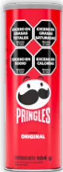
PRINGLES ORIGINAL x104g ART. 6323 EAN 7896004009155 Cantidad por bulto 18