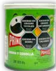
PRINGLES CREMA Y CEBOLLA x40g ART. 6331 EAN 38000846748 Cantidad por bulto 12