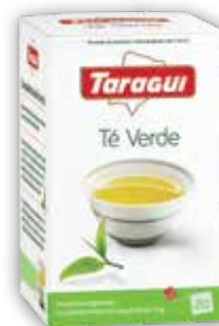
TÉ VERDE x20 saq.