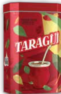
TARAGÜI LATA x500g