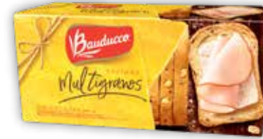
BAUDUCCO TOSTADA MULTIGRANO x142g