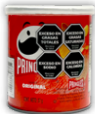
PRINGLES ORIGINAL x37g ART. 6330 EAN 38000846731 Cantidad por bulto 12