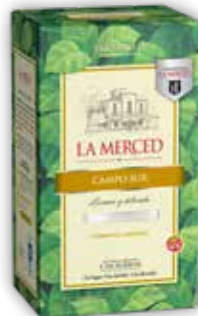
CAMPO SUR OC x500g