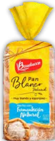
PAN BLANCO x400g