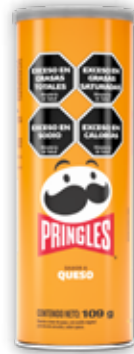
PRINGLES QUESO x109g ART. 6325 EAN 7896004009179 Cantidad por bulto 18