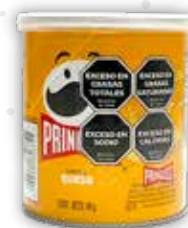
PRINGLES QUESO x40g ART. 6332 EAN 38000846755 Cantidad por bulto 12