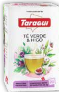
TÉ VERDE & HIGO x20 saq.