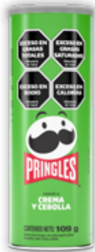
PRINGLES CREMA Y CEBOLLA x109g ART. 6324 EAN 7896004009162 Cantidad por bulto 18