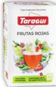
FRUTAS ROJAS x20 saq.