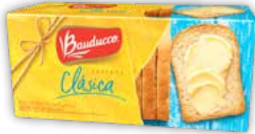
BAUDUCCO TOSTADA CLÁSICA x142g