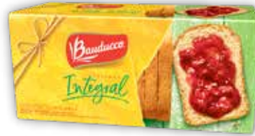
BAUDUCCO TOSTADA INTEGRAL x142g