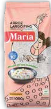
ARROZ MARÍA LARGO FINO x1000g