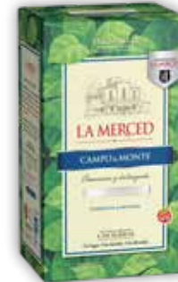
CAMPO & MONTE OC x500g