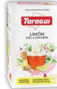
LIMÓN, MIEL & JENGIBRE x20 saq.