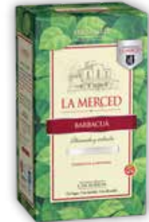
BARBACUÁ OC x500g