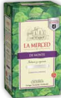
MONTE OC x500g