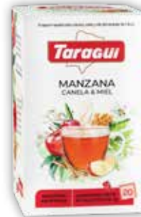
MANZANA, CANELA & MIEL x20 saq.