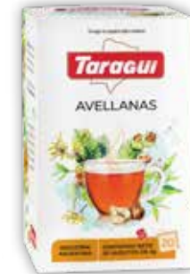
AVELLANAS x20 saq.