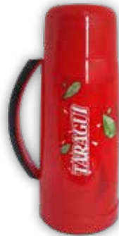
TERMO LUMILAGRO 1L