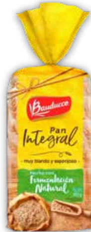
PAN INTEGRAL x400g