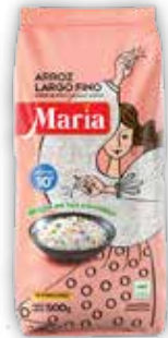
ARROZ MARÍA LARGO FINO x500g